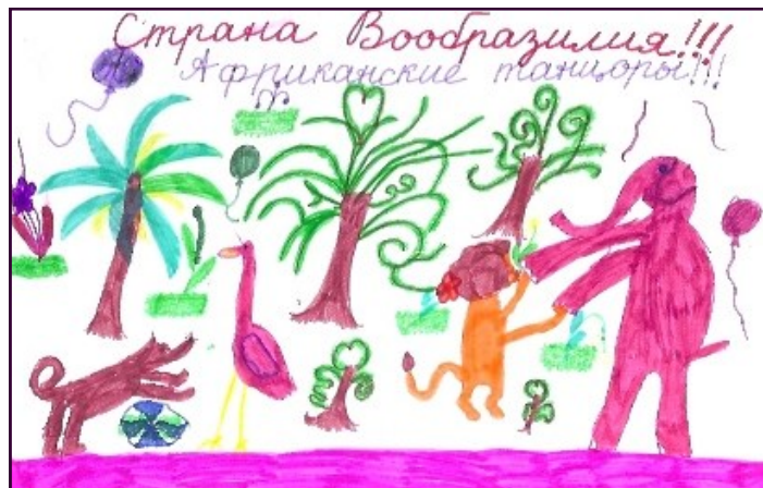
Рис. Евчук Настя, 4а